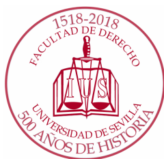
Imagen y Añoranzas José León-Castro Alonso